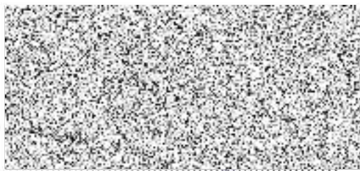
razítko a podpis půjčitele