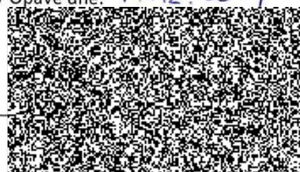
Holasická 16, 747 05 Opava