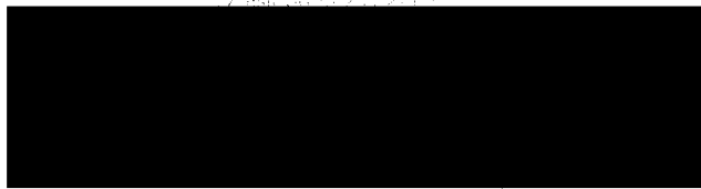
rektor VŠB – Technická univerzita Ostrava

VYSOKÁ ŠKOLA BÁŇSKÁ TECHNICKÁ UNIVERZITA OSTRAVA 17. listopadu 2019