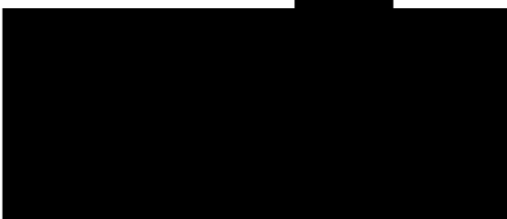
rektor Univerzita Hradec Králové