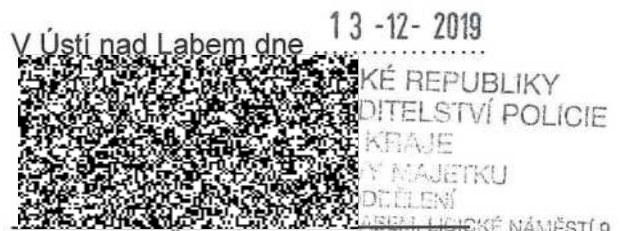
Michal Ženíšek vedoucí automobilního oddělení