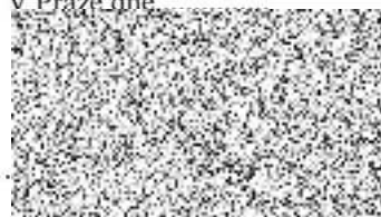
Ing. Miloš Petera

náměstek hejtmanky pro oblast životního prostředí a zemědělství