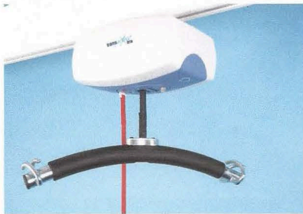
zvedák Freeway, typ Xtra