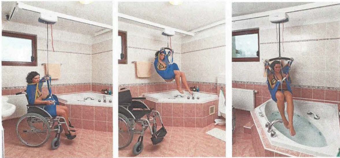
ilustrační foto obdobné instalace v Uherském Hradišti