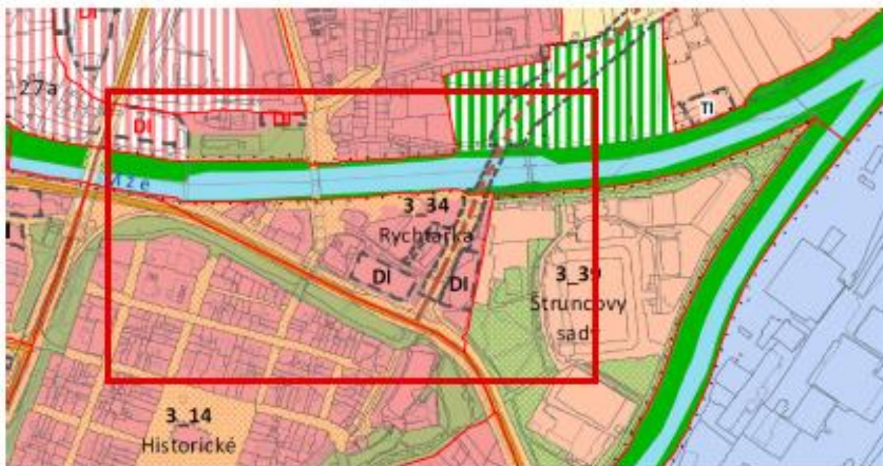
výřez z ÚP města Plzeň

Výřez z platného Územního plánu Plzeň s vyznačením řešeného území