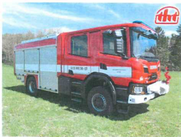
Ilustrativní foto CAS 20 SCANIA P440 4x4 s hliníkovou karoserií nástavby