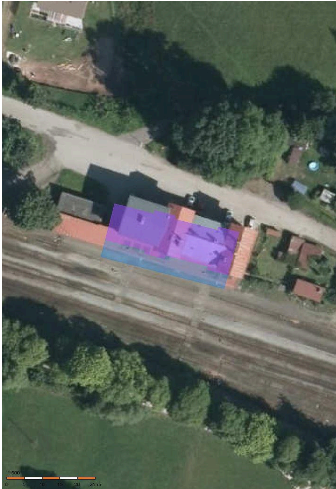
Příloha č. 1a)