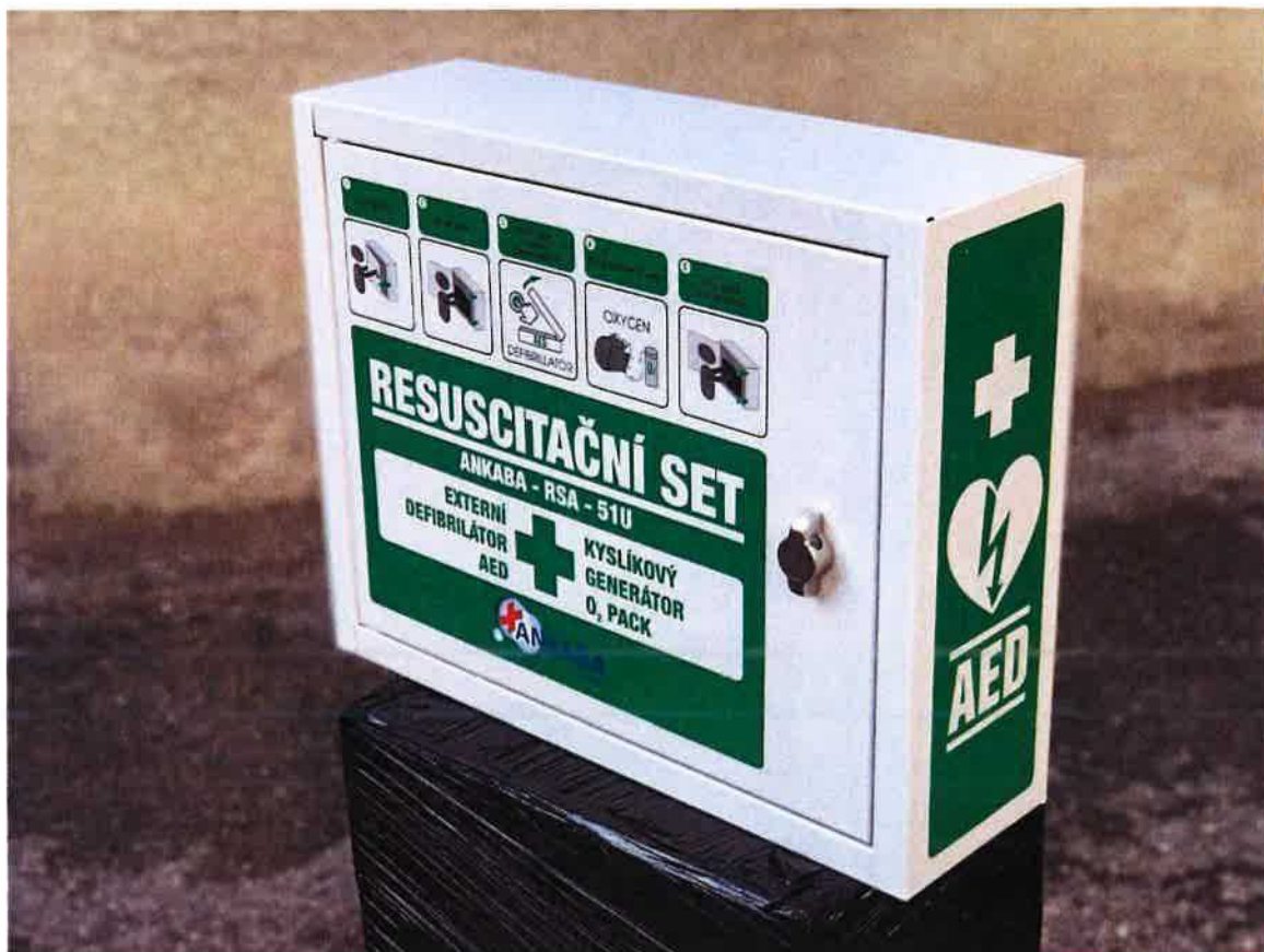
Obrázek 3 - Pohled zprava