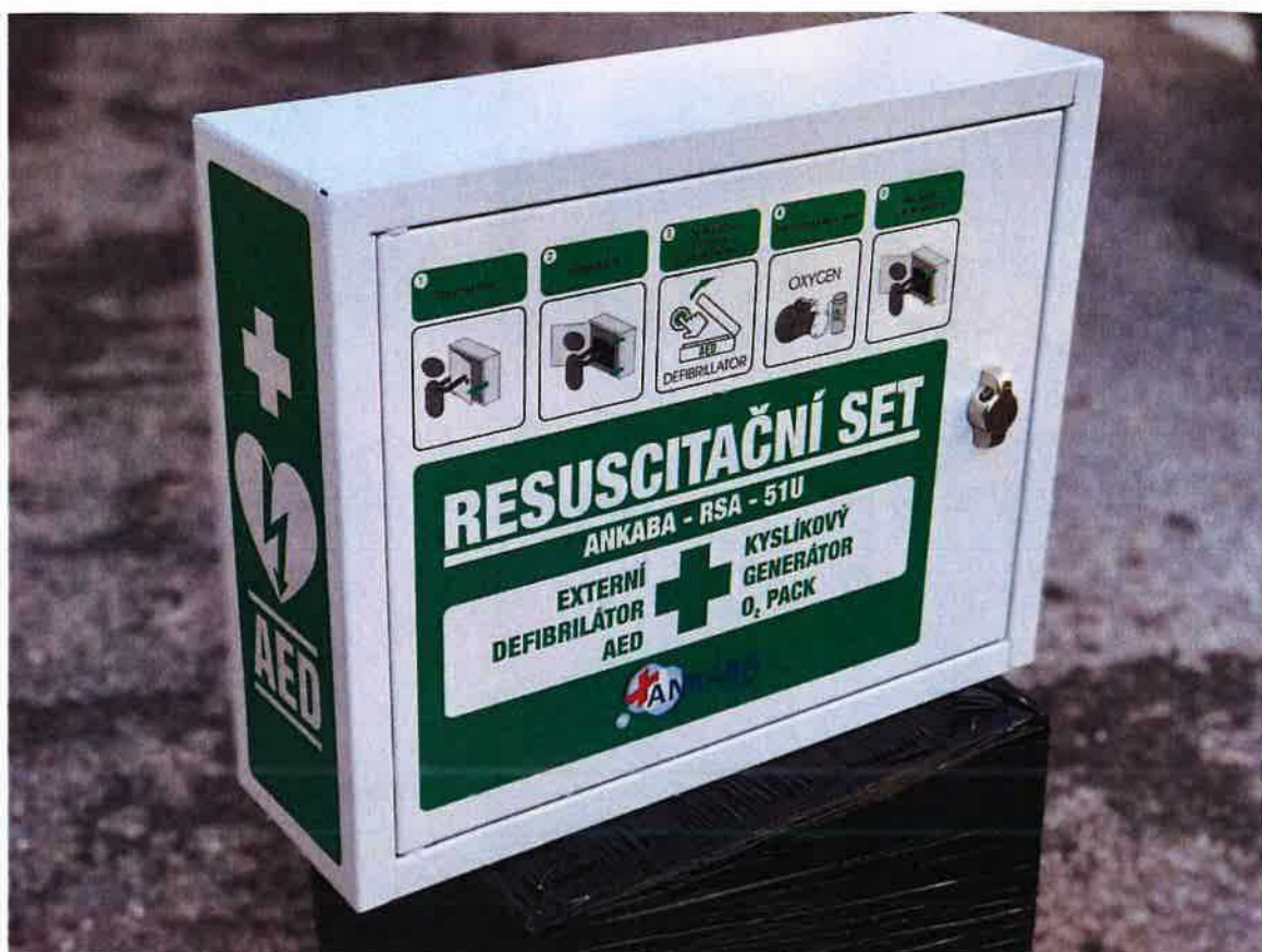
Obrázek 4 - Pohled zleva