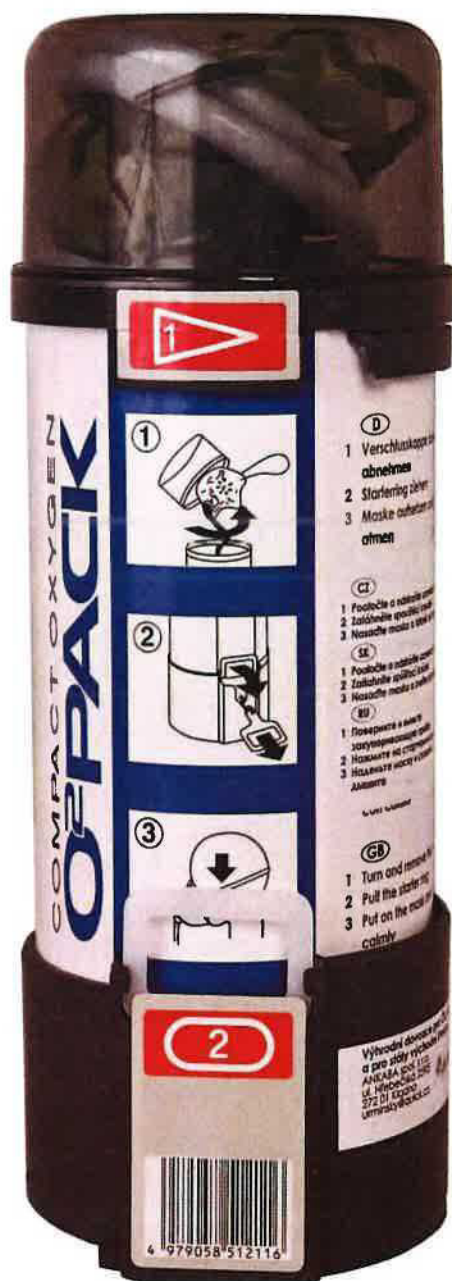
Obrázek 1 - Kyslíkový generátor O2 Pack