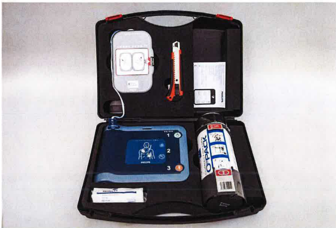
Obrázek 2 - Pohled zředu