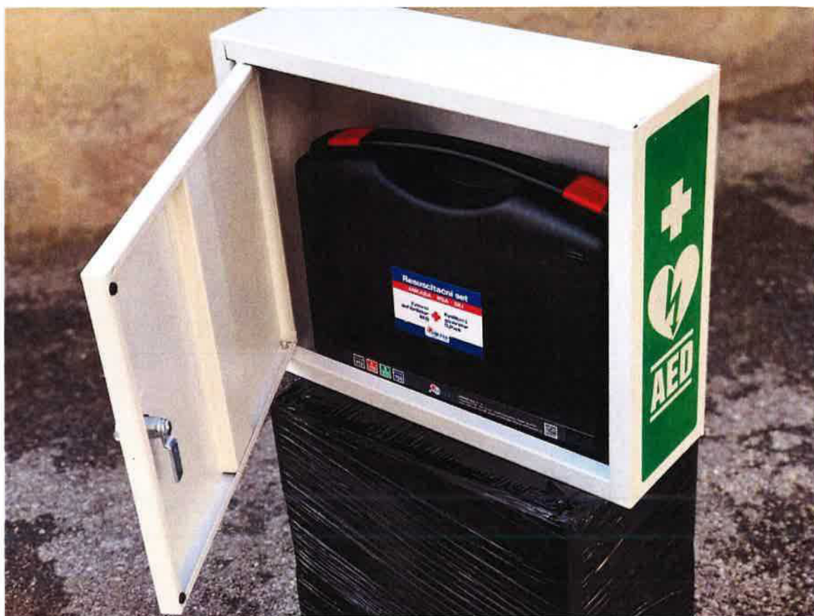
Obrázek 5 - Otevřená skříňka s RSA 51U