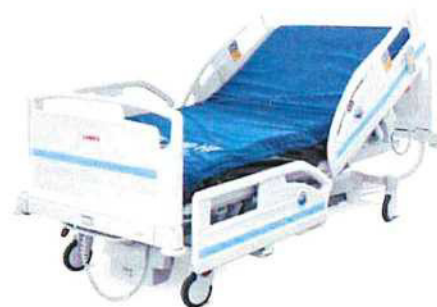
Matrace bez kompresoru