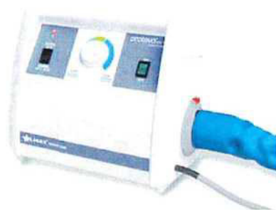
Kompresor CliniCare HF (SCU)