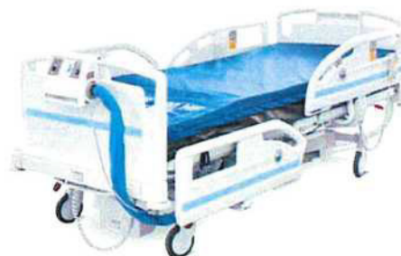
Matrace připojená ke kompresoru