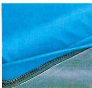
Zip chráněný klopou