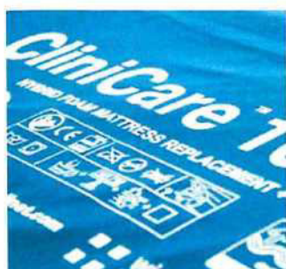
Potah pružný všemi směry