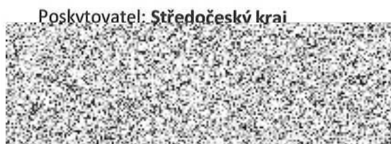
Martin Draxler radní pro oblast regionálního rozvoje cestovního ruchu a sportu