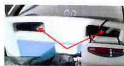
Mezery pro vedení lůžka