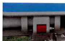
Bezpečná aretace postranic