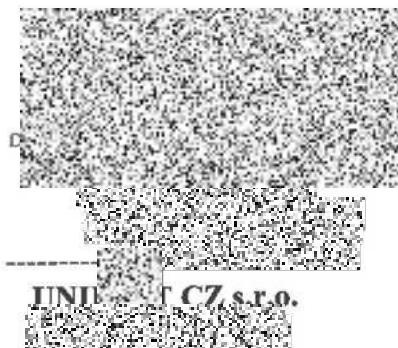
JINI CZ s.r.o. jednatel