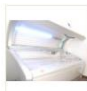
6 VOLAREZA K.Vary -solarium