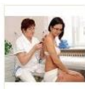
1 VOLAREZA K.Vary -plynová injekce