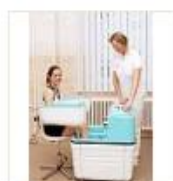
13 VOLAREZA K.Vary -Hauffeho koupele