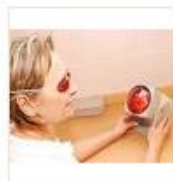
7 VOLAREZA K.Vary -solux