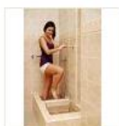
16 VOLAREZA K.Vary -šlapací koupele