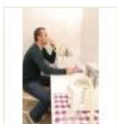
2 VOLAREZA K.Vary -inhalace