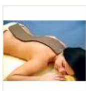
14 VOLAREZA K.Vary -parafango