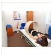
8 VOLAREZA K.Vary -magnetoterapie