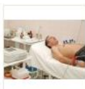
3 VOLAREZA K.Vary-EKG