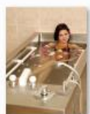
20 VOLAREZA K.Vary -uhličitá koupel