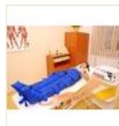
11 VOLAREZA K.Vary -lymfodrenáž přístrojová