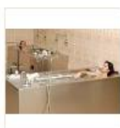
15 VOLAREZA K.Vary -vířivá koupel