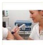
5 VOLAREZA K.Vary -rázová vlna