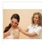
12 VOLAREZA K.Vary -masáž klasická částečná