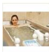
17 VOLAREZA K.Vary -perličková koupel