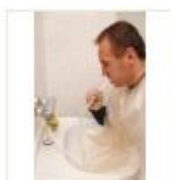
4 VOLAREZA K.Vary -zubní irigace