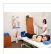
18 VOLAREZA K.Vary -elektroléčba