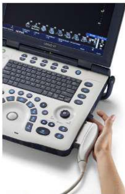
Obr. č. 2: Připojení sondy k LOGIQ V2