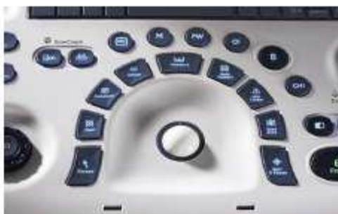
Obr. č. 3: Detail ovládacího trackballu LOGIQ V2