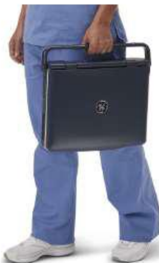
Obr. č. 5: Integrované madlo pro bezpečný transport systému LOGIQ V2