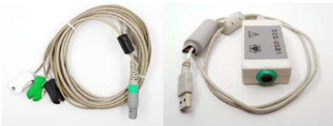
Obr. č. 6: EKG modul systému LOGIQ V2