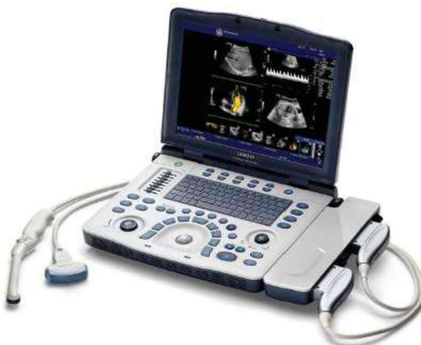
Obr. č. 1: Konzole mobilního systému LOGIQ V2 včetně přepínače 2 sond