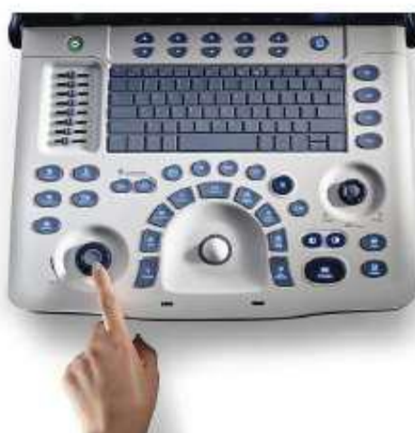
Obr. č. 4: Detail ovládacího panelu a funkce AUTO (automatické optimalizace)