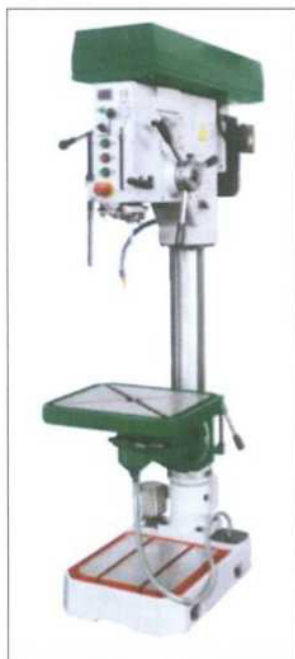
Obr. 1 – Sloupová vrtačka V 300 gL