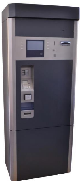
POKLADNA S PODSTAVCEM