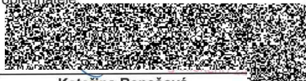
Katerina Benešová zástupce vedoucího ONM SLZ PP ČR