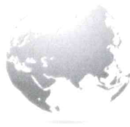
Vždy blízko zákazníkovi