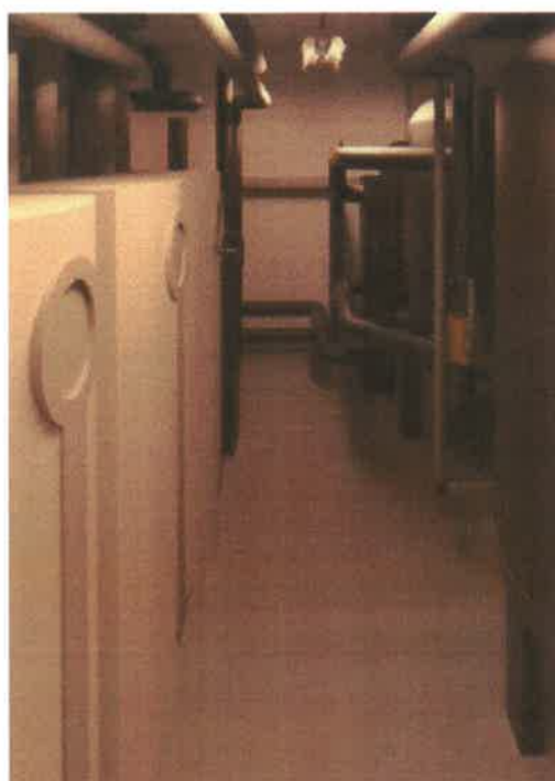
Obr. 3 Vizualizace BIM modelu technické místnosti v areálu AdMaS (VUT)