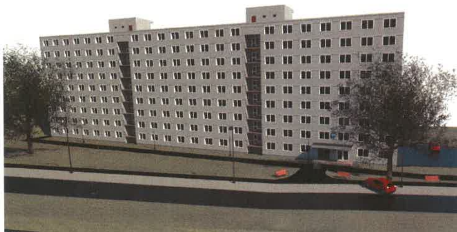
Obr. 1 Vizualizace BIM modelu areálu kolejí VUT v Brně, blok A05

Ústav geodézie Fakulty stavební VUT v Brně se věnuje informačnímu modelování od roku 2013. Zejména v rámci aktivit výzkumného centra AdMaS a projektu TA ČR Centra kompetence TE02000077 „Inteligentní regiony – Informační modelování budov a sídel, technologie a infrastruktura pro udržitelný rozvoj“ měli pracovníci ústavu možnost realizovat několik informačních modelů budov nebo města, zúčastnit se několika zahraničních akcí v oblasti BIM a rozvíjet aktivity v rámci výzkumných činností.