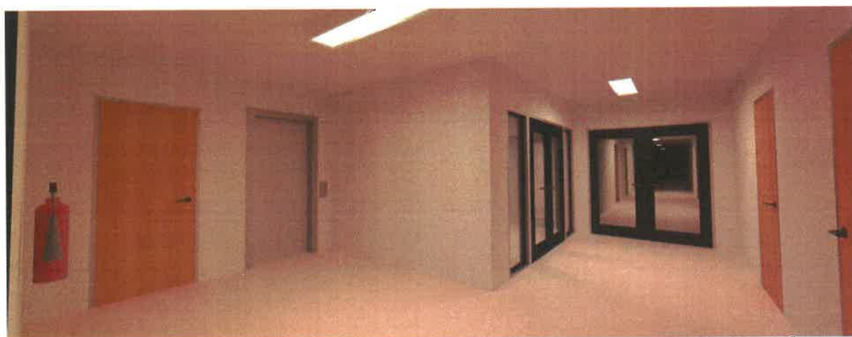
Obr. 2 Vizualizace BIM modelu areálu kolejí VUT v Brně, blok A05