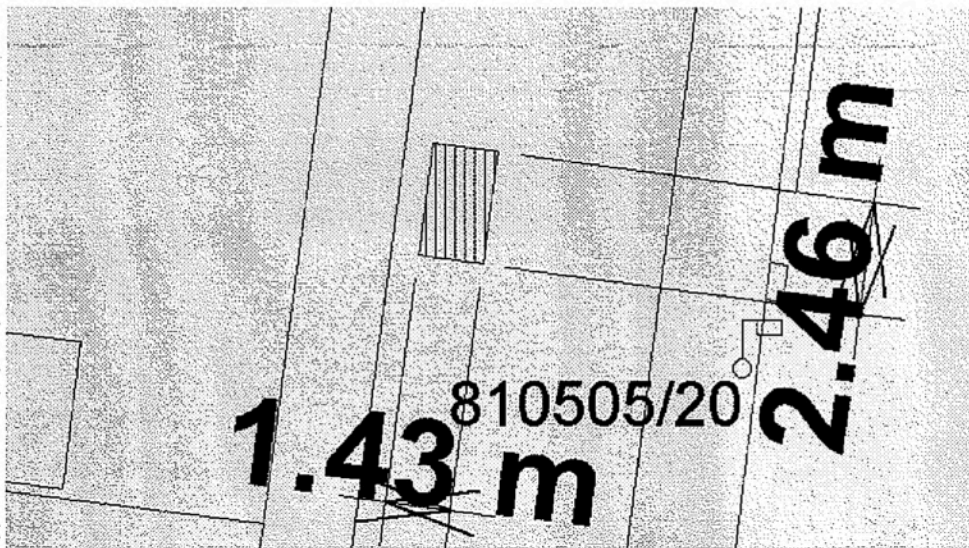
Figura je v tomto případě složena ze čtyř bodů