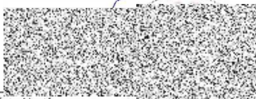
Město Vsetín starosta města