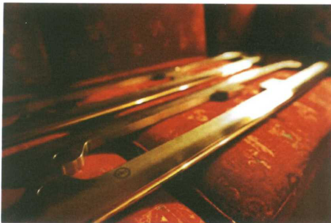
Obr. 1 –ilustrační foto - Závodní nože pro bobý

Nože pro závodní bobý jsou vyráběny ze speciální slitiny oceli, která je obrobena dle požadovaných technických parametrů, předepsaných mezinárodní federací IBSF.