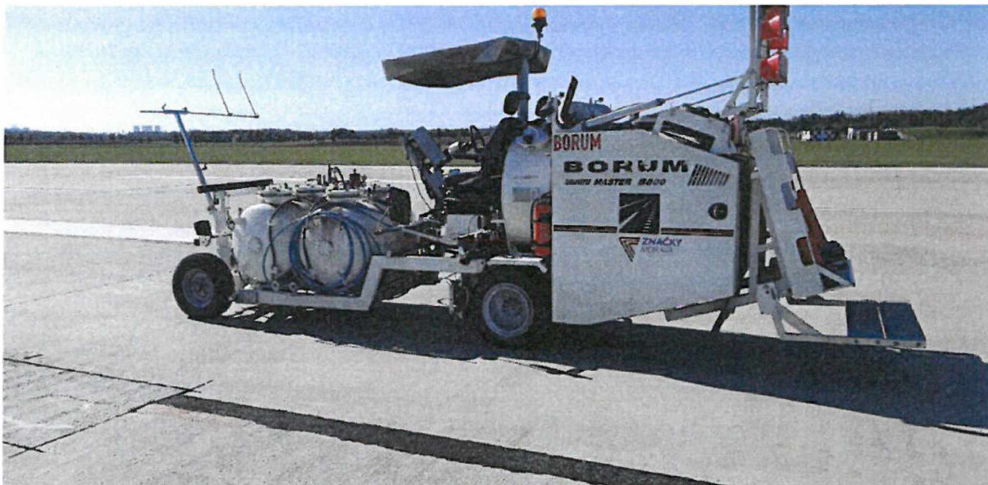
BORUM Master 5000, stroj bez SPZ, Výrobní číslo 220205