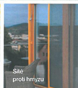
Sítě proti hmyzu

Děkujeme, že jste si vybrali výrobky značky CLIMAX.