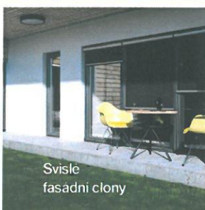
Svislé fasadní clony