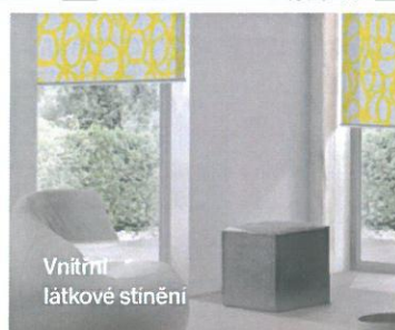
Vnitřní látkové stínění