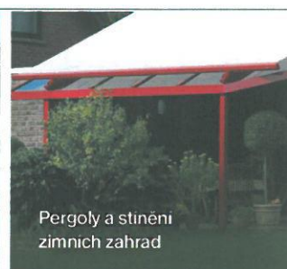
Pergoly a stínění zimních zahrad