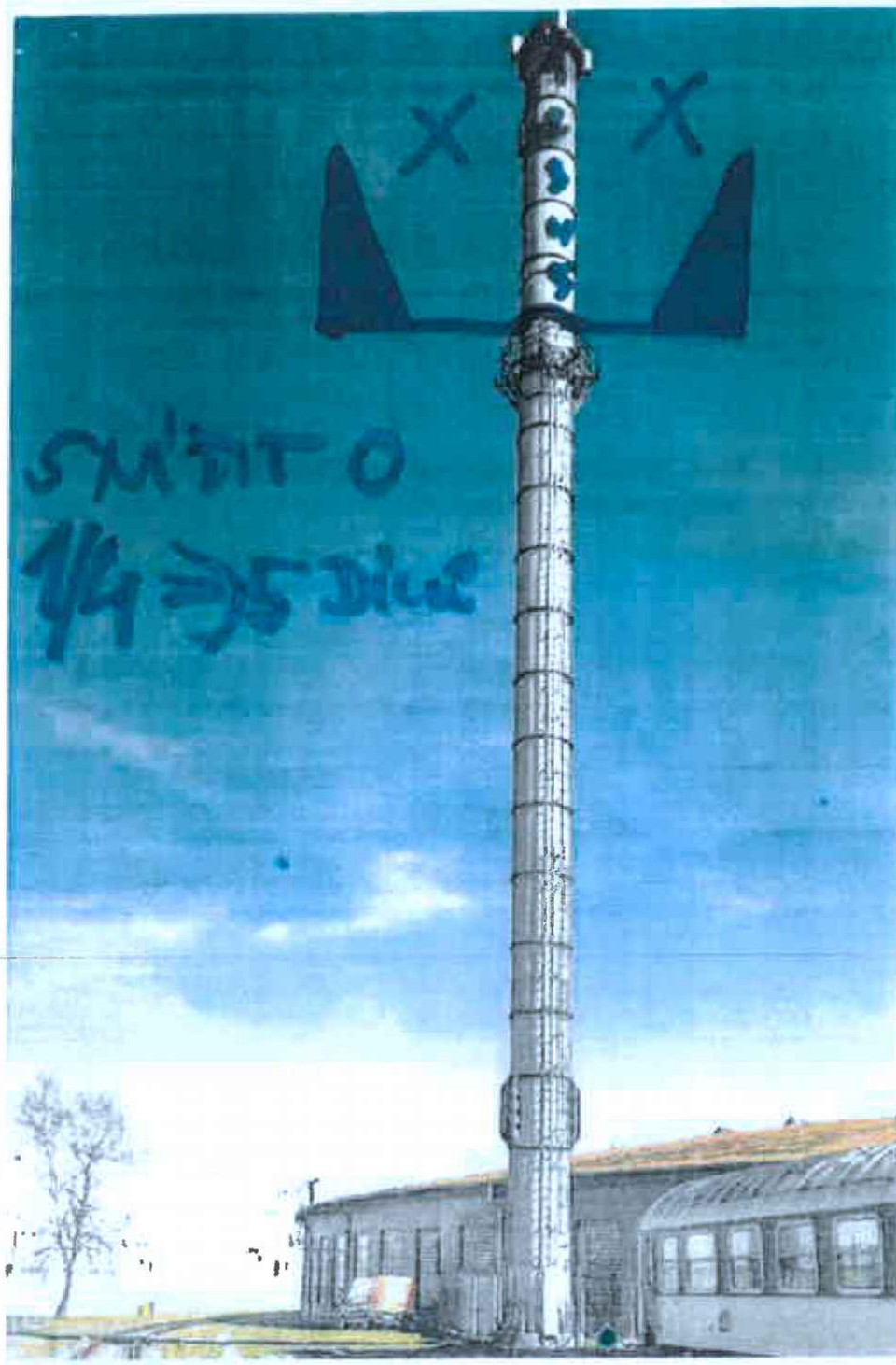
OBR: 01 – Úprava komína