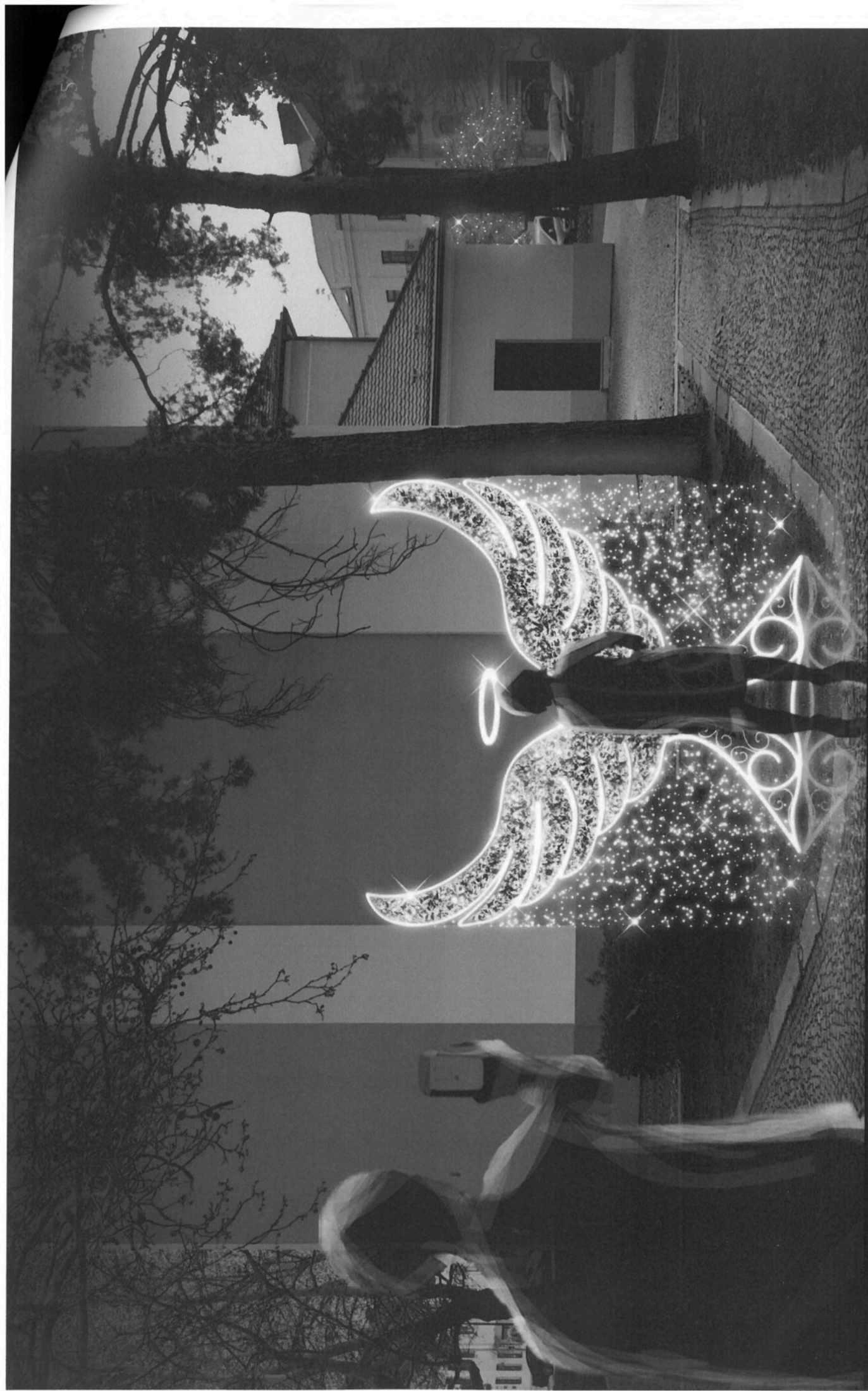
VARIANTA 2 - INTERIÉR