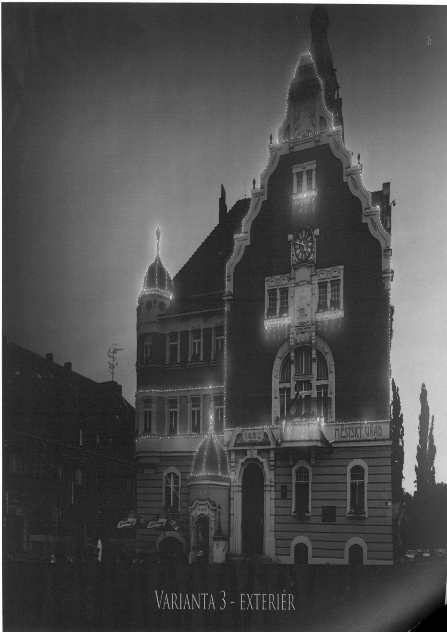
VARIANTA 3 - EXTERIÉR