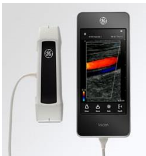
Obr. č. 1: Konzole kapesního mobilního systému Vscan Extend Dual Probe