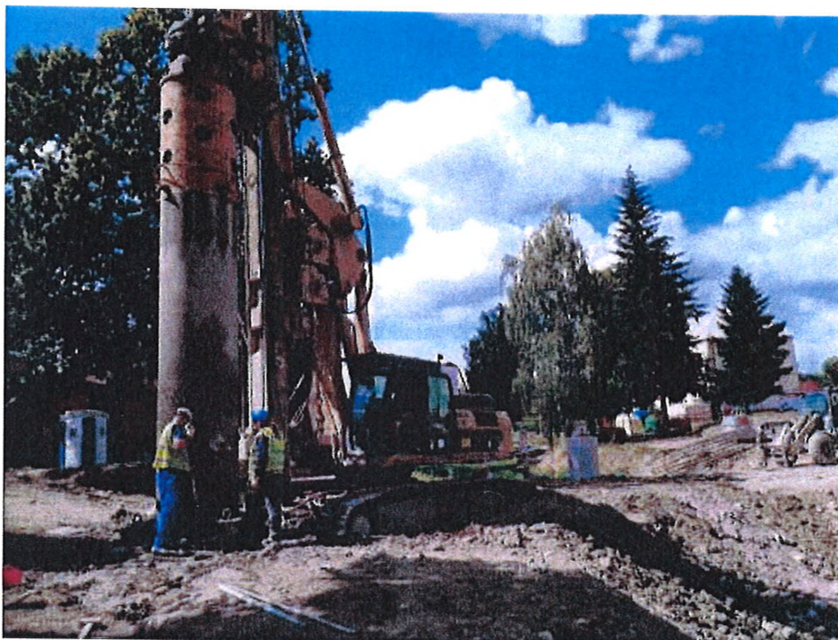
Obr. 1 Pohled na lokalitu