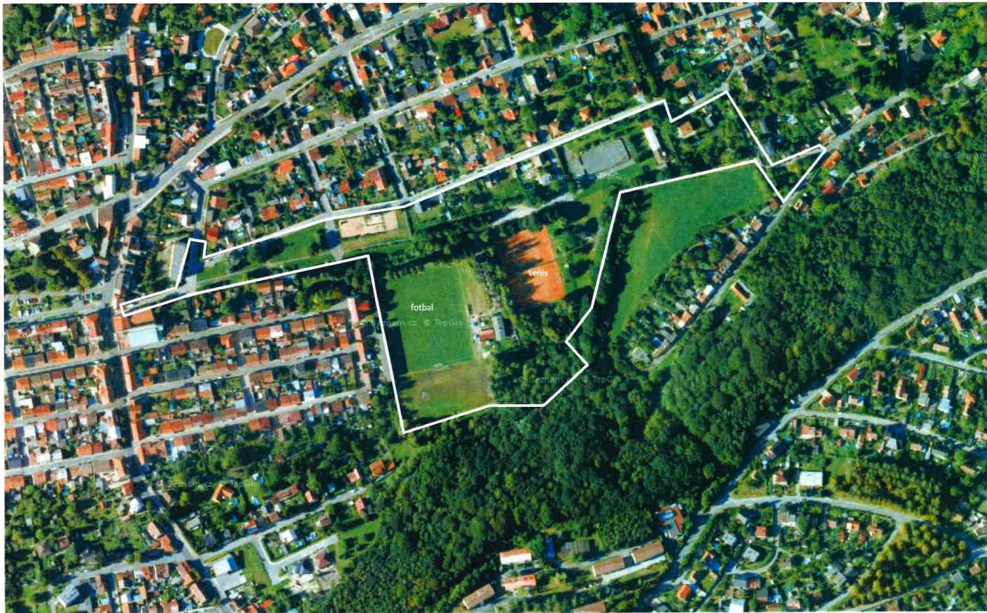
Švermovské údolí / širší vztahy