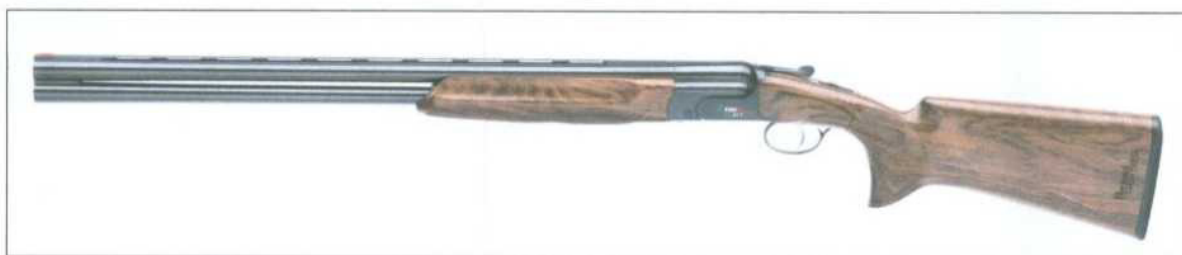
Obr. 1 – ilustrační obrázek – broková puška Perazzi High TechSkeet