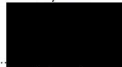
Vladimír Veselý člen výboru