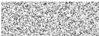
Zdeněk Porcal pověřená osoba v zastupování vedoucího odboru investic a regionálního rozvoje, oddělení investic