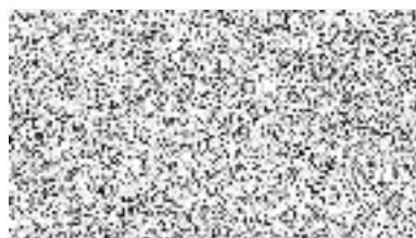
Jitka Gorčíková v.z. jednatele na základě plné moci