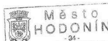
Mgr. Milan Lúčka starosta Města Hodonína