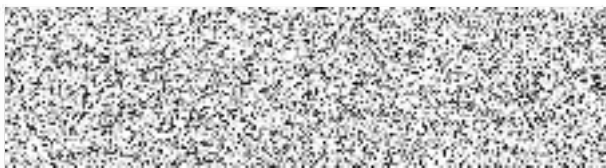
jméno, příjmení a podpis osoby pověřené pojistitelem uzavřením pojistné smlouvy