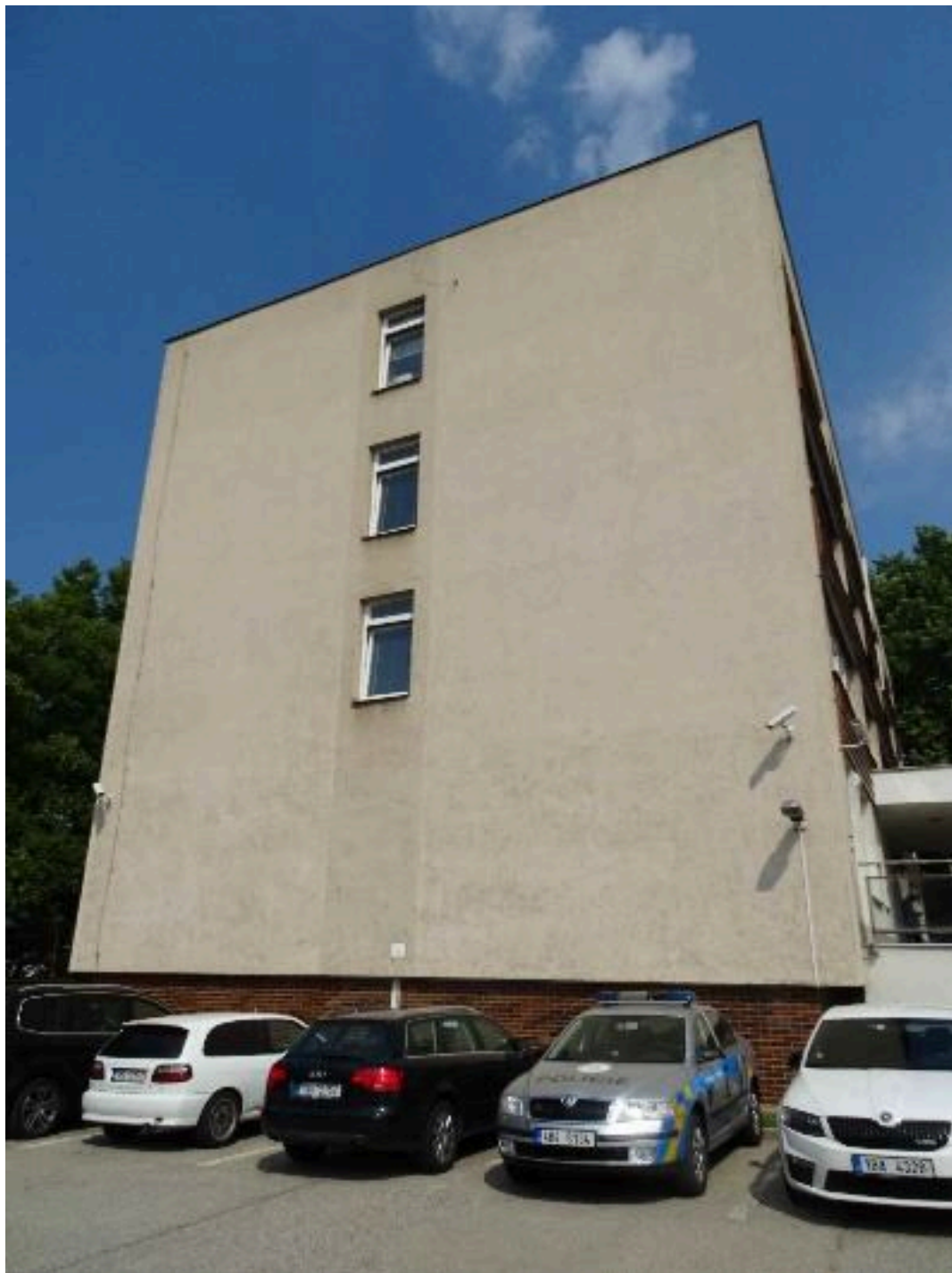
EST.6 – boční stěna, kde bude uchycen nový stožár sirény (podél okna chodby ve 4.NP)