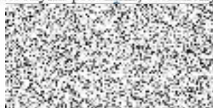
ředitel společnosti PRAHA 10 - Majetková, a.s.

MČ PRAHA zast. správce: PRAHA 10 - Majetková a.s. Vršovicích 101 38 Praha 10 DIČ: CZ00003941 -4-