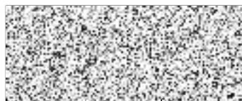
náměstek pro řízení FM PRAHA 10 - Majetková, a.s.