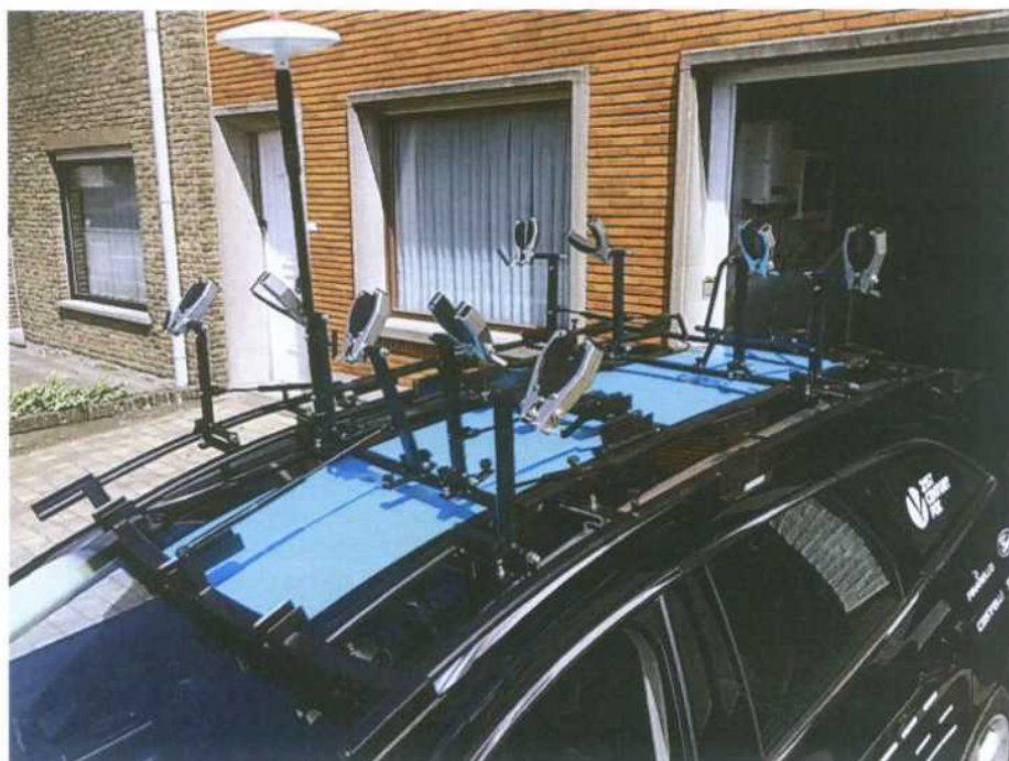
Obr. 1 – ilustrační foto – speciální nosič na kola

- 3 kusy speciálních nosičů kol, na který je možno umístit celkem 8 kompletů kol.