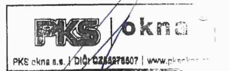
za dodavatele Ondřej Pešek