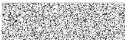
Statutární město Jihlava Mgr. Petr Laštovička náměstek primátorky