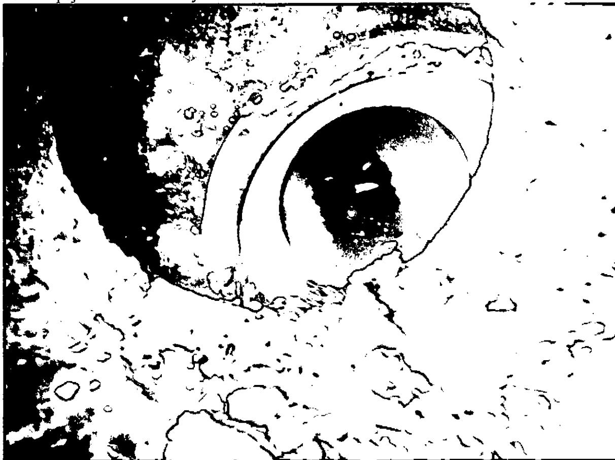
Foto napojení dešťové šachty do kanalizace

Vícenáklady jsou doloženy položkovým rozpočtem (příloha č. 2), který je nedílnou součástí tohoto protokolu (Příloha č. 1) a bude tvořit nedílnou součást dodatku k SoD.