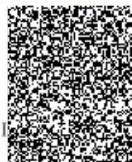
plk. I. Mik