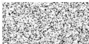
vedoucí OSB PRAHA 10 - Majetková, a.s.

Pokud zhotovitel zjistí, že cena dodávky bude vyšší než cena uvedená na objednávce, musí o této skutečnosti informovat objednatele a ten musí tuto vyšší cenu písemně odsouhlasit. Práce dle této objednávky jsou provedeny řádně, pokud jejich provedení odpovídá podmínkám stanoveným touto objednávkou, dohodou smluvních stran či příslušnými právními, technickými, hygienickými a jinými předpisy.