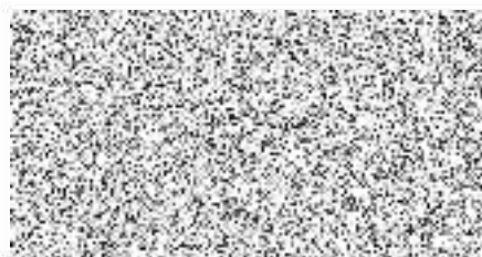
Oprávněná osoba za Příjemce