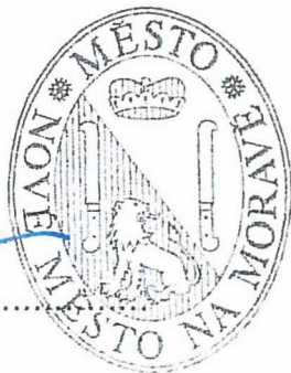
Michal Šmarda starosta

SPORTOVNÍ KLUB NOVÉ MĚSTO NA MORAVĚ VLACHOVICKÁ 1355 592 31 NOVÉ MĚSTO NA MORAVĚ IČ: 433 79 460 tel: +420 566 616 337 fax: +420 566 616 930