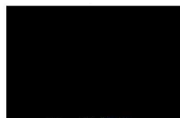
Ondřej Gros starosta Městské části Praha 8