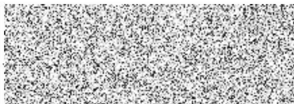
předseda výkonného výboru

Ve Vsetíně dne 10. 10. 2019 Za příjemce: FC Vsetín, z.s.