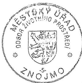
Ing. Jana STARÁ vedoucí odboru životního prostředí Městského úřadu Znojmo

Správní orgán upozorňuje, že toto závazné stanovisko nenahrazuje souhlas k provozování zařízení k využívání, odstraňování, sběru nebo výkupu odpadů dle § 14 odst. 1 zákona o odpadech.